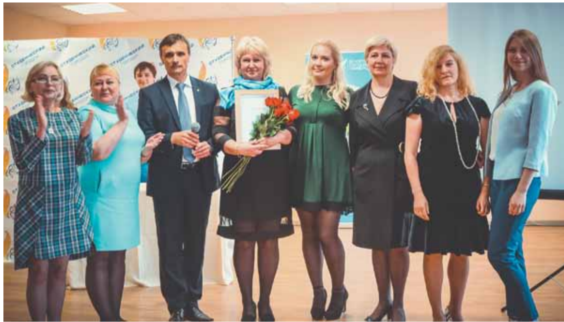
Супрацоўнікі сёмага інтэрната з узнагародамі

На працягу двух гадоў адміністрацыя Студэнцкага гарадка БДУ выбрала найлепшы інтэрнат і найлепшы педагогічны калектыў. Сярод прафесіяналаў і незамежных працаўнікоў дзевяці інтэрнатаў складана было вызначыць, хто пераўзыходзіць калегу ў арганізацыі ідэалагічнай і выхаваўчай працы.