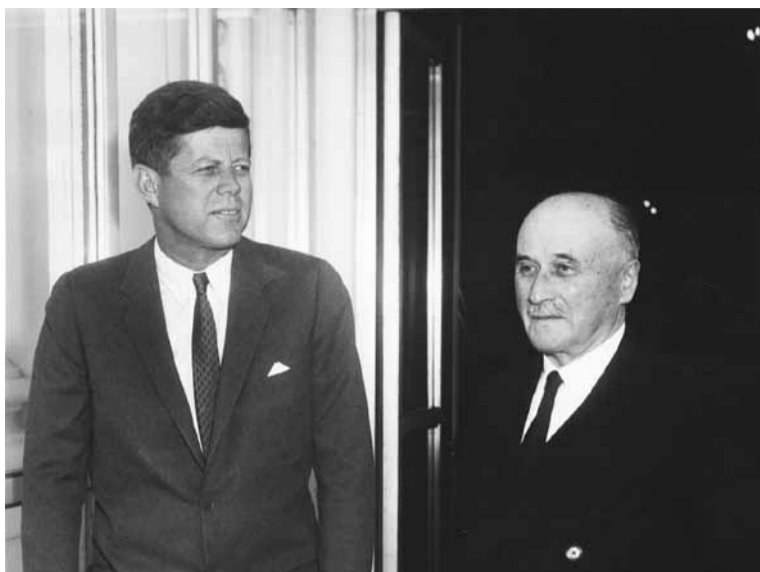
Жан Манэ з прэзідэнтам ЗША Джонам Ф. Кенэдзі

Жан Амэр Мары Габрыэль Манэ (фр. – Jean Omer Marie Gabriel Monnet; 1888–1979) – выбітны французскі дыпламат, эканаміст. З’яўляўся перакананым і ўплывым прыхільнікам еўрапейскага адзінства. За значную ролю ў працоўванні ідэі стварэння Еўрапейскага аб’яднання вугалю і сталі (ЕССC; фактычна на яго аснове пасля ўзнікла аб’яднанне, якое сёння мы ведаем як Еўрапейскі саюз) Жана Манэ клічуць «Бацькам Еўропы». Высокая пасада старшыні аб’яднання ЕССC (1952–1955) не была для Жана Манэ першым вопытам у вялікай дыпламатыі – па заканчэнні Першай сусветнай вайны ён з 1919 па 1923 гады быў намеснікам Генеральнага сакратара Лігі нацый. Француз па паходжанні, Манэ супрацоўнічаў з Жоржам