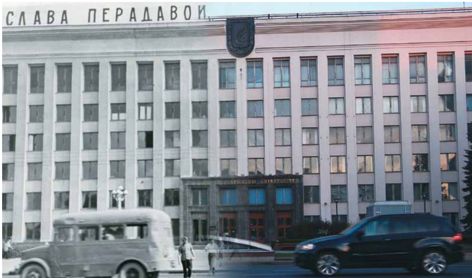
Калых Ангела ШЧЭНІКВА