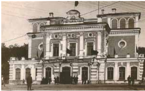
Торжественное открытие БГУ состоялось 11 июля 1921 г. в здании Минского городского театра (нынешний Купаловский театр)

Новый импульс к воплощению идеи был дан на Первом Всебелорусском съезде в декабре 1917 г. В созданной комиссии для разработки предложений по реформированию образования и созданию белорусского университета работали выдающиеся ученые, имевшие опыт университетского администрирования. Главная роль принадлежала историку Митрофану Викторовичу Довнар-Запольскому и филологу, этнографу, бывшему ректору Варшавского императорского университета Евфимию Федоровичу Карскому . Последний подготовил проект устава Белорусского университета, опубликованный в газете «Вольная Беларусь». После принятия съездом первого пункта резолюции о создании белорусского органа управления вооруженные отряды большевиков окружили место проведения съезда и в ночь на 18 декабря 1917 г. разогнали его депутатов. Нежелание Облсисполкомзапа, созданного