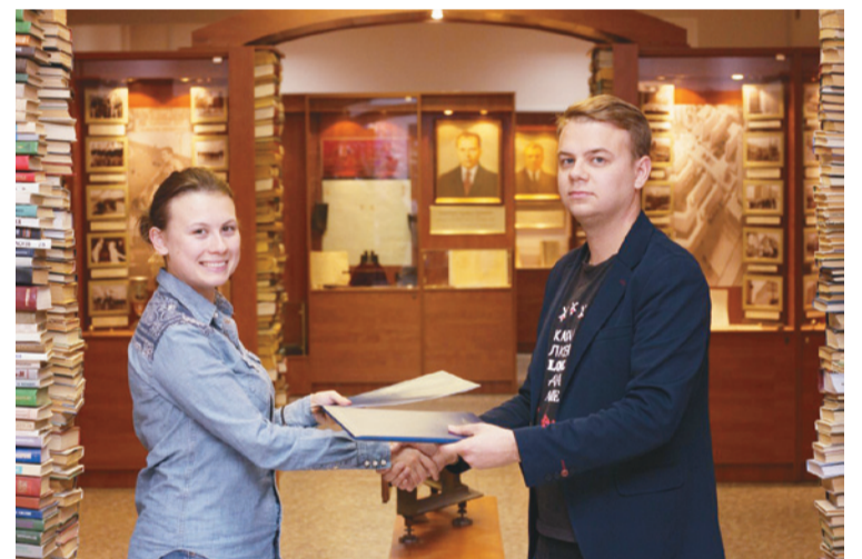
Пагадненне паміж Студэнцкай асамблеяй БДУ і студэнцкім самакіраваннем Малдаўскага дзяржаўнага ўніверсітэта