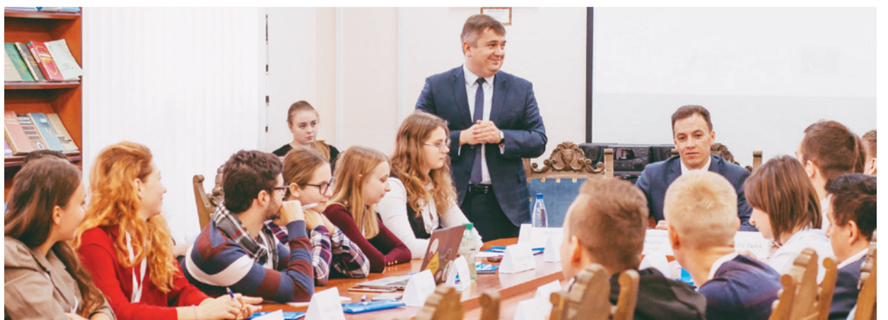
Адкрыццё Міжнароднага моладзевага форуму «M.I.P.»