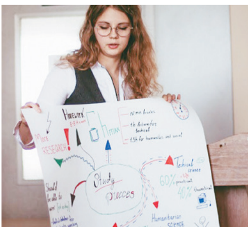
Абарона праекта «Універсітэт пакалення Z»