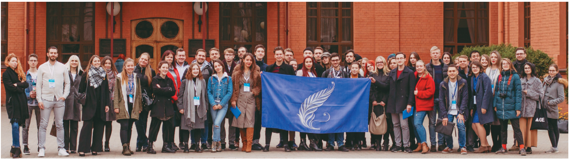
Самыя яркія актывісты студэнцкіх арганізацый з 12 краін сустрэліся 28–31 кастрычніка на IV Міжнародным моладзевым форуме «M.I.P.: Моладзь. Інтэграцыя. Развіццё». Іх аб'яднала тэма «Універсітэт пакалення Z: эвалюцыя вышэйшай адукацыі»