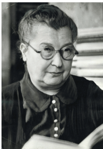
Вольга Дзмітрыеўна Акімава

Нарадзілася ў сядзібе Серкавец. У 1933–1935 гг. навучалася ў Вышэйшай сельскагаспадарчай партыйнай школе імя У. І. Леніна. У 1940 г. скончыла Мінскі юрыдычны інстытут (з 1954 г. быў рэарганізаваны ў юрыдычны факультэт БДУ). У першыя дні акупацыі г. Мінска арганізавала адну з першых падпольных груп. Пасля ўсталявання сувязі з партызанамі ў жніўні 1941 г. група актыўна ўдзельнічала ў разведвальна-дыверсійнай працы. Гераічна выявіла сябе ў аперацыі «Адплата» 22 верасня 1943 г., падчас якой быў ліквідаваны генеральны камісар Генеральнай акругі Беларусь Вільгельм Кубэ. Указам Прэзідыума Вярхоўнага Савета СССР ад 29 кастрычніка 1943 г. М. Б. Осіпавай было прысвоена званне Герой Савецкага Саюза з узнагароджаннем ордэнам Леніна і медалём «Залатая Зорка». Пасля вызвалення г. Мінска актыўна ўдзельнічала ў аднаўленчых працах. Займала адказныя пасады ў вышэйшых органах дзяржаўнай улады. За высокія заслугі была ўзнагароджана ордэнам Айчыннай вайны I ступені, ордэнам Працоўнага Чырвонага Сцяга.