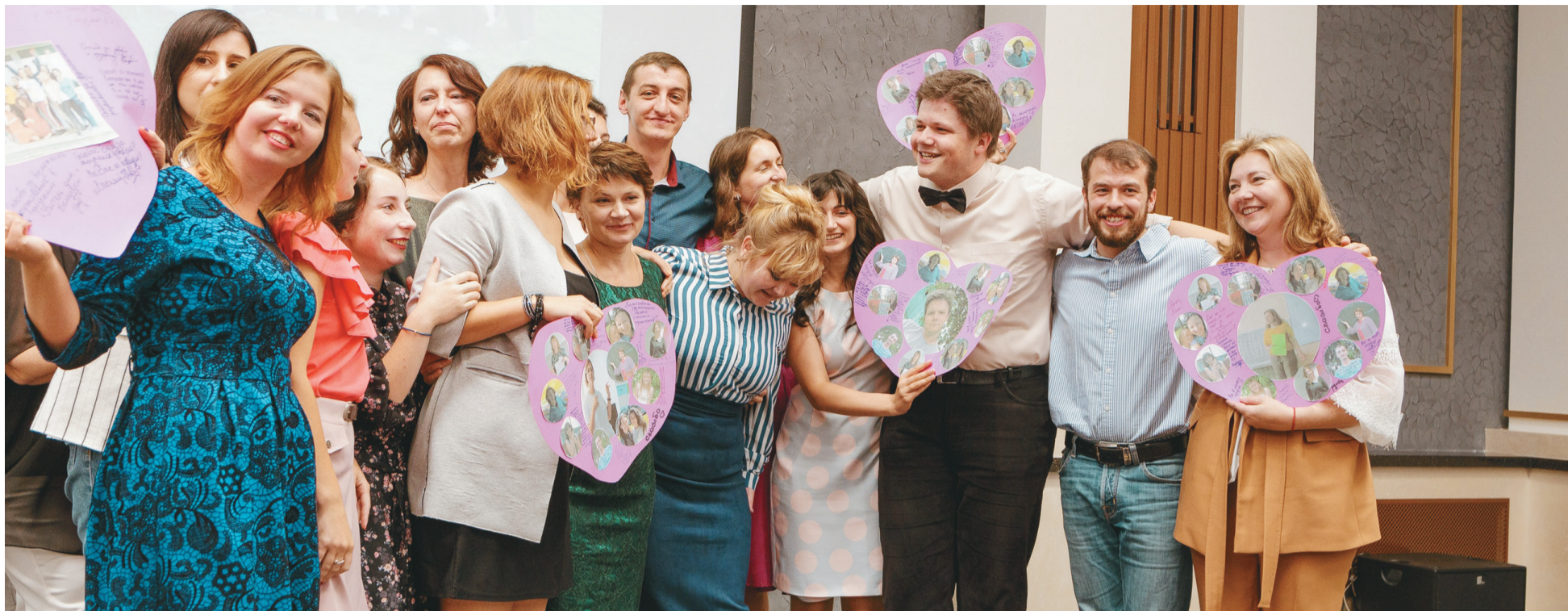
Каманда арганізатараў і ўдзельнікаў праграмы «Настайнік для Беларусі» – гэта захопленыя людзі, якія любяць сваю прафесію