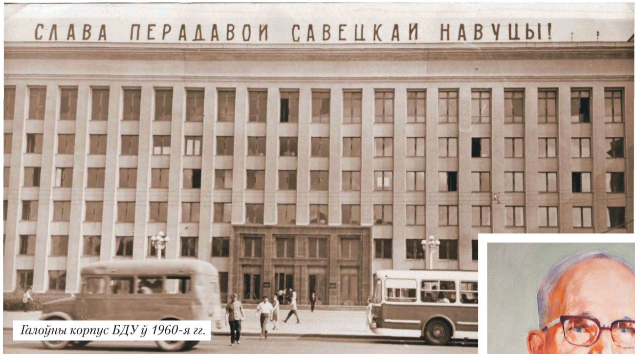
Галоўны корпус БДУ ў 1960-я гг.

З канца 50-х гадоў, згодна з «Палажэннем аб экзаменацыйных камісіях па прыёму ўступных экзаменаў у ВНУ СССР» ад 16 са-