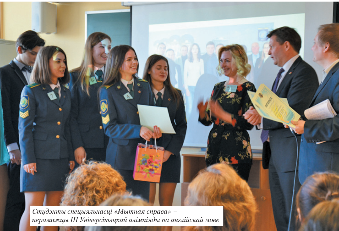
Студэнты спецыяльнасці «Мытная справа» – пераможцы III Універсітэцкай алімпіяды па англійскай мове