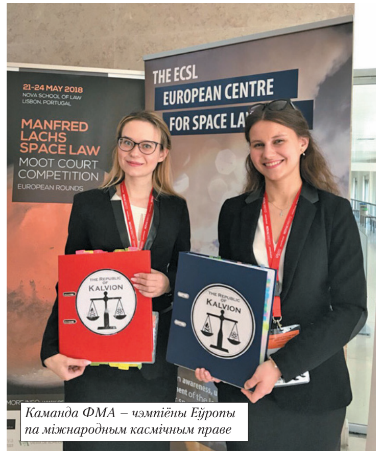
Каманда ФМА – чэмпіёны Еўропы па міжнародным касмічным праве

– Са студэнтамі ФМА часта сустракаюцца паслы розных краін і прадстаўнікі міжнародных арганізацый. Хто іх ініцыюе і якія сустрэчы, на Ваш погляд, былі найбольш цікавымі?