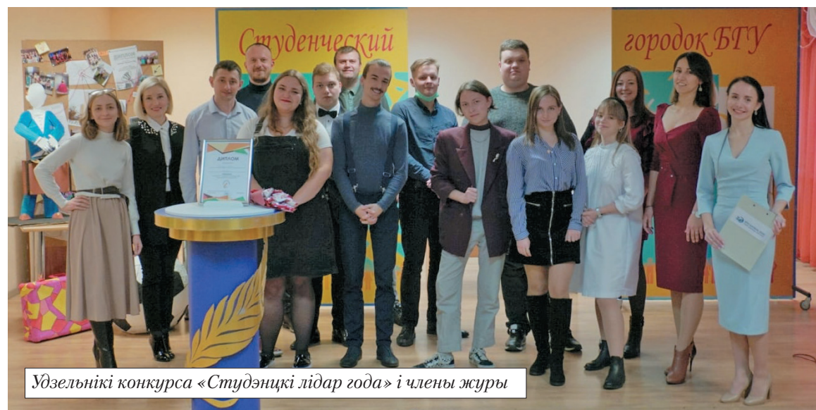
Удзельнікі конкурсу «Студэнцкі лідар года» і члены журы