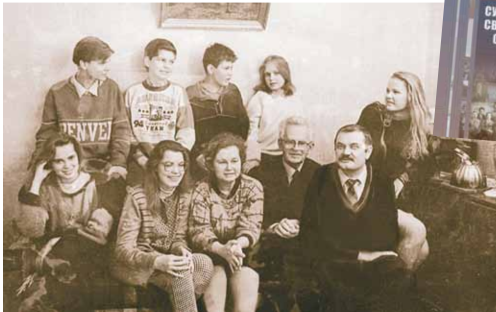
Сям'я Ігнаценкаў – бацька, дачка, зяць і ўнукі. Усе працавалі ці вучыліся ў БДУ

Тады робіцца відавочна, што яго дынастыя, яго сям'я – гэта ўсе мы, так ці інакш звязаныя з БДУ праз дзесяцігоддзі. Па меркаванні аднаго з аўтараў і натхняльнікаў выдання Тамары Карасцялёвай