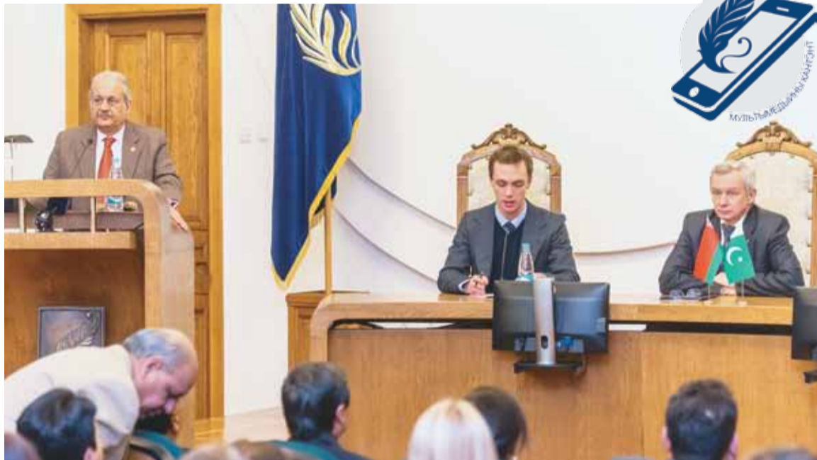
Міян Раза Рабані выступае ў залі Савета БДУ

У сваім выступленні рэктар БДУ акадэмік Сяргей Абламейка адзначыў, што ў апошні час кантакты паміж дзвюма краінамі ў адукацыйнай сферы інтэнсіўна развіваюцца: «Падпісаны шэраг дамоў паміж Міністэрствам адукацыі Беларусі і Міністэрствам федэральнай адукацыі. Дасягнуты дамоўленасці з універсітэтамі Пакістана наконт распрацоўкі сумеснай адукацыйнай праграмы па абмене студэнтамі. Цяпер абмяркоўваецца пытанне пра арганізацыю цэнтралізаванага накіравання для навучання ў беларускія ВНУ 50 грамадзян Пакістана. Наладжваецца супрацоўніцтва ў сферы прафесійнай адукацыі. Бакі інтэнсіўна працуюць у галіне навуковага супрацоўніцтва».