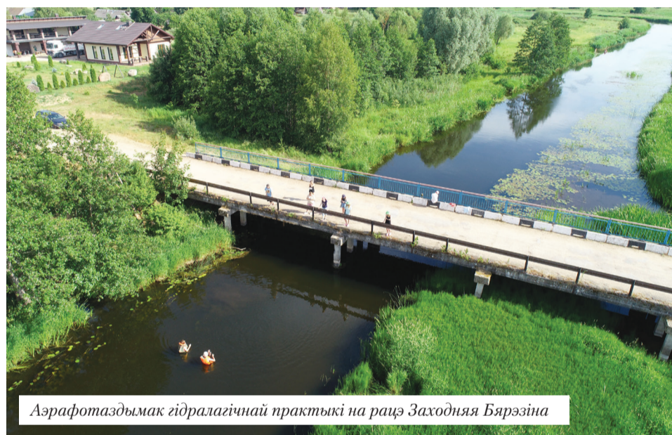
Аэрафотаздымак гідралагічнай практыкі на рацэ Заходняя Бярэзіна

комплекснае апісанне глебавага покрыва. Працуюць у камандзе: хлопцы спраўляюцца з рыдлёўкай, трымаюць карты, дзяўчаты робяць фотаздымку і запісваюць даныя.