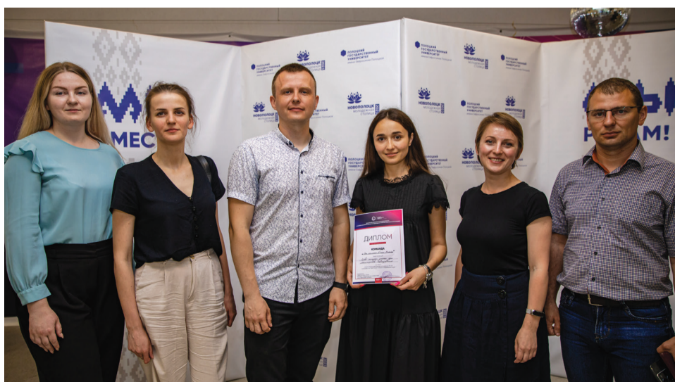
Каманда маладых навукоўцаў-гульцоў «Што? Дзе? Калі?»

Сярод аспірантаў, якім былі прызначаны стыпендыі Прэзідэнта Рэспублікі Беларусь на 2023 год, 10 прадстаўнікоў БДУ. Стыпендыі Прэзідэнта таленавітым маладым навукоўцам атрымалі 10 супрацоўнікаў універсітэта. На дадзены момант гранты рэктара БДУ рэалізуюць 9 навукоўцаў.