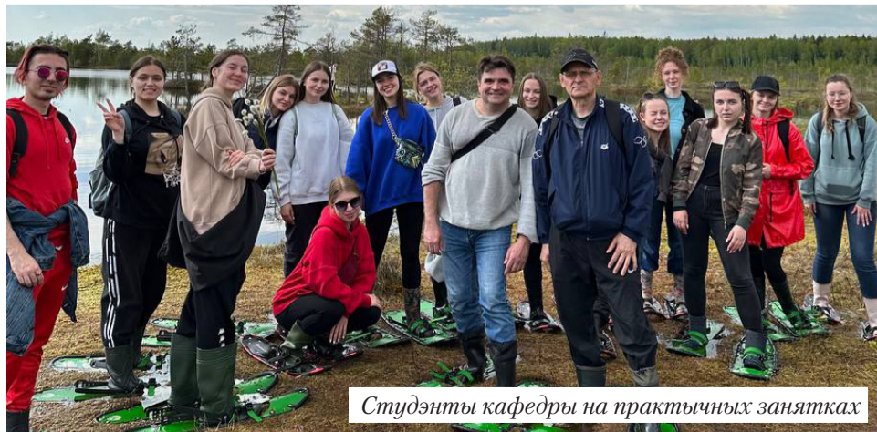
Студэнты кафедры на практычных занятках

— Я вельмі ўдзячная кафедры за тое, што яна дае студэнтам практычныя веды і рыхтуе да жыцця. Навучанне на кафедры ідзе на стыку розных дысцыплін: эканоміка, маркетынг, менеджмент, бухгалтэрыя, моцная падрыхтоўка па замежных мовах. Гэта забяспечвае студэнтам такі шырокі круггляд, што пасля мы можам быць паспяховымі і будаваць кар'еру ў розных сектарах эканомікі і на розных пасадах. Калі ты студэнт, ты не заўсёды можаш ацаніць важнасць і значнасць тых ведаў, якія нам даюць. Але ў далейшым яны становяцца для нас сапраўды вельмі карыснымі.