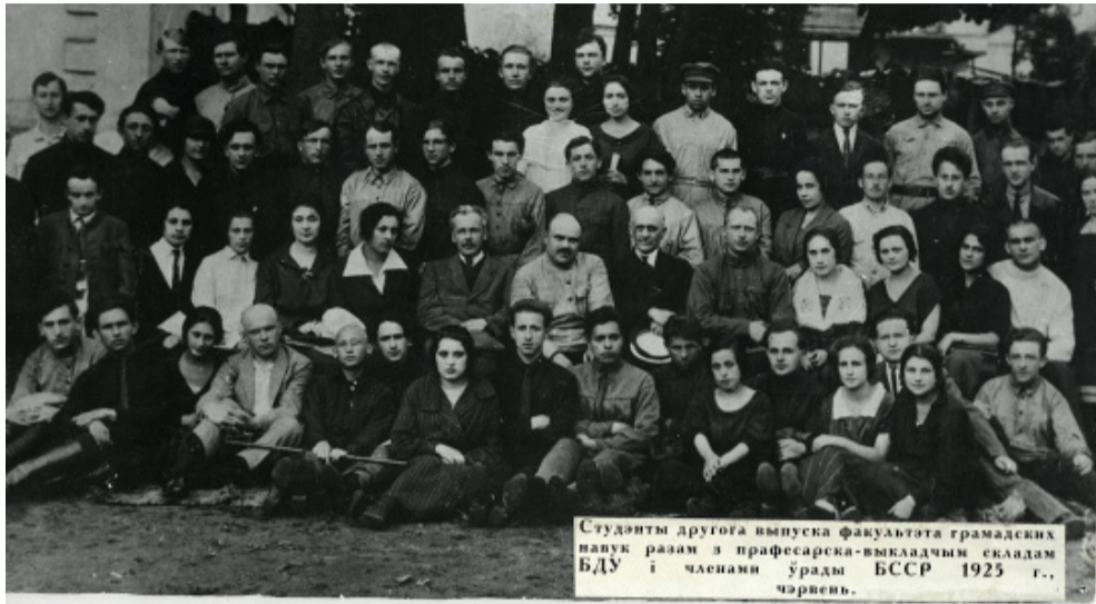
Студэнты другога выпуска факультэта грамадскіх навук разам з прафесарска-выкладчым складам БДУ і членамі ўрады БССР 1925 г., чэрвень.

Эканамічнаму факультэту – 25 гадоў. Але яго гісторыя нашата старэйшая і сыходзіць сваімі каранямі да самага пачатку існавання БДУ.