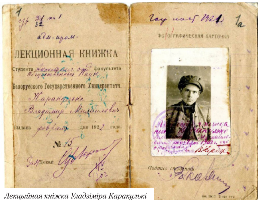
Лекцыйная кніжка Уладзіміра Каракулькі